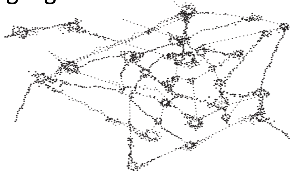
Illustration fra Lederliv

Ledelse er ikke lokaliseret hos "nogen" men frit tilgængeligt